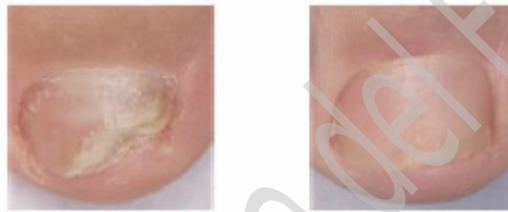
Prima del trattamento

E' importante proseguire il trattamento con lo smalto medicato fino alla completa risoluzione dell'infezione e alla completa rigenerazione dell'unghia. La durata del trattamento dipende dalla gravità e dalla localizzazione dell'infezione. In genere occorrono circa 6 mesi di terapia per le unghie delle mani e da 9 a 12 mesi per le unghie dei piedi. Lei vedrà l'unghia sana ricrescere con il ridursi dell'unghia malata.