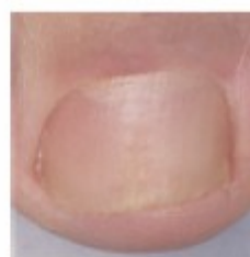
Dopo il trattamento

Se non osserva miglioramenti dopo 3 mesi deve consultare il medico.